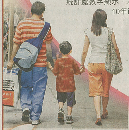
▲在完整家庭成長對小孩發展有重要影響；但就算父母離異，只要雙方妥善處理，仍可為孩子造就健康成長環境。(資料圖片)

統計處數字顯示，本港01年有不足8.2萬名未滿18歲單親子女，但至10年已升破10萬人，升幅達22%。